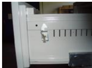
Pozitie nr. 2