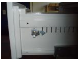
Blocarea sertarelor de la dispozitivul central de blocare (sertar de sus) Poziția nr.1

Dacă sertarul de sus are sistemul de blocare în poziția nr.1 permite deschiderea celorlalte sertare de mai jos numai dacă este în poziție de deschis extras de cel puțin de 2 cm.