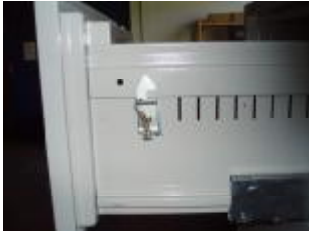
Dispozitivul central de blocare (sertar de sus) în Poziția nr.2.

Sistemul de închidere central al organizatorului este situat în partea dreaptă al primului sertar de sus. Vezi imaginea de mai jos.