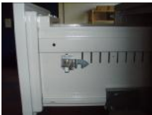
Dispozitivul central de blocare (sertar de sus) în Poziția nr.1

!!ATENȚIE!! În condițiile în care sertarul de sus este închis utilizând sistemul de închidere cilindric, acest sertar este închis fizic, doar celelalte sertare se pot deschide. (vezi “deschidere cu cheie”).